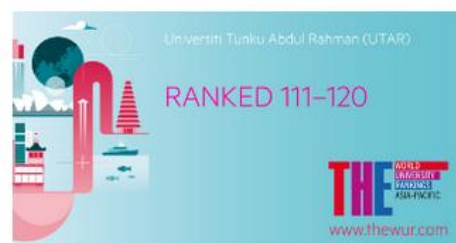
2019年的泰晤士高等教育亚太大学排名前120名