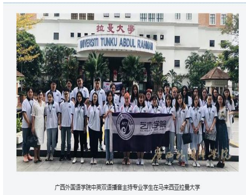
广西外国语学院中英双语播音主持专业学生在马来西亚拉曼大学