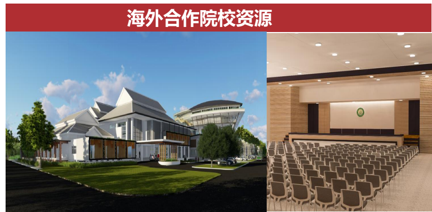
海外合作院校资源