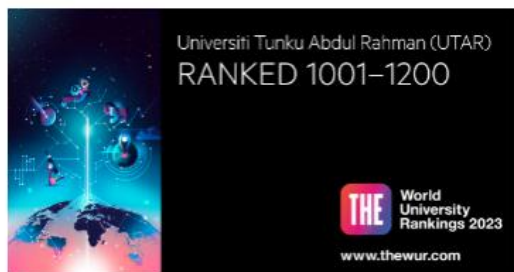
2023年的泰晤士高等教育世界排名前1200名