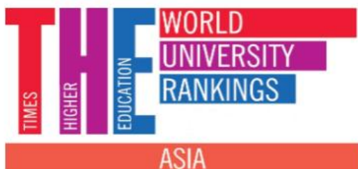
2022年的泰晤士高等教育亚洲大学排名前400名