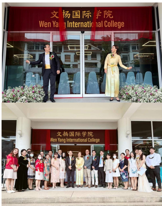
本硕博立交桥快速通道