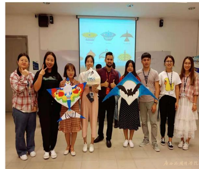
与UTAR-拉曼大学课堂指导老师合影